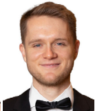
Sussmann Mattis Schulmusik, KFR Vocals

Eine grosse Anzahl von hoch qualifi- zierten Musikleh- rpersonen steht für unseren Unterricht zur Verfügung.