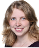
Henkhaus Solvejg Klavier Blockflöte