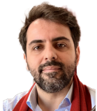
Thaqi Vendim Gitarre E-Gitarre

Eine grosse Anzahl von hoch qualifi- zierten Musikleh- rpersonen steht für unseren Unterricht zur Verfügung.