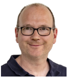
Geiser Mathias Schulmusik