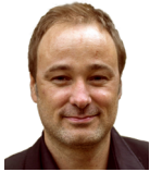
Noth Christian Trompete Tenorhorn