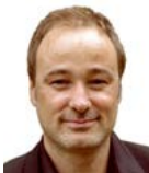
Noth Christian Trompete, Tenorhorn