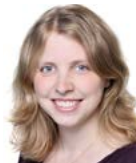
Henkhaus Solvejg Klavier