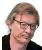
Flisch Rätus E-Bass